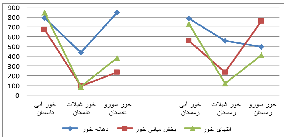
شکل ۱- تراکم کل کفزیان (عدد در متر مربع) در طول فصل تابستان و زمستان سال ۱۳۹۰ در سه خور شیلات، آبی و سورو بندرعباس