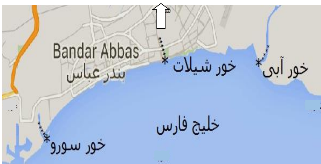
نقشه ۱- موقعیت خورهای سورو، شیلات و آبی در بندرعباس، خلیج فارس

در تحقیق حاضر، سه خور شیلات، آبی و سورو که از خورهای مرکزی شهر بندرعباس می باشند، مورد مطالعه قرار گرفته است. با توجه به نوع آب و هوای منطقه بندرعباس که دارای دو فصل گرم و سرد است، نمونه برداری طی دو ماه مرداد و دی در سال ۱۳۹۰ انجام گردید. در هر کدام از خور ها سه ایستگاه در ابتدا، میان و انتهای خور و در مجموع ۹ ایستگاه، در نظر گرفته شد و نمونه های رسوب توسط مغزه گیر با