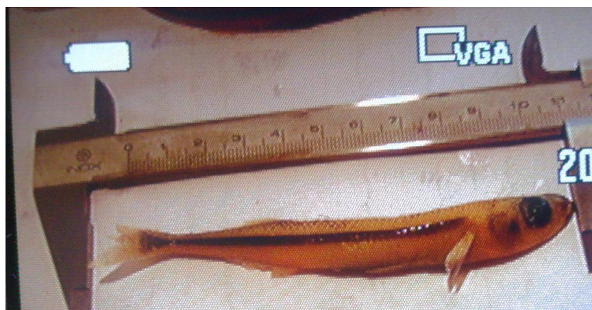
شکل ۱- تصویر شیشه ماهی Atherina boyeri دریای خزر (www.Fishbase.com)

شیشه ماهی گونه ( Atherina boyeri ) به راسته Atheriniformes (گل آذین ماهی شکلان) و خانواده Atherinidae (گل آذین ماهیان) تعلق دارد (ستاری، ۱۳۸۲). گونه Atherina boyeri با نام محلی شیشه ماهی در تمام طول آب های ساحلی ایران در دریای خزر یافت می گردد و جمعیت زیادی را در دریا تشکیل می دهد (Caspian environment.com).