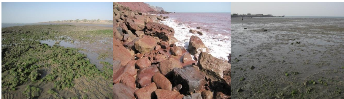
شکل ۲- ساحل ماسه‌ای قلوه سنگی (راست)، ساحل صخره‌ای (مرکز)، ساحل گلی (چپ) در جزیره هرمز.

درصد از طول سواحل این جزیره را به خود اختصاص می‌دهند (شکل ۳). همچنین در جدول (۲) میانگین شیب بستر، دانه بندی رسوبات و ساختار ساحل به تفکیک هر یک از ایستگاه‌ها ارائه شده است. ایستگاه چهار با ۱/۹۵ درجه کمترین شیب و ایستگاه هفت با ۱۰/۳ درجه بیشترین شیب را دارا بودند.