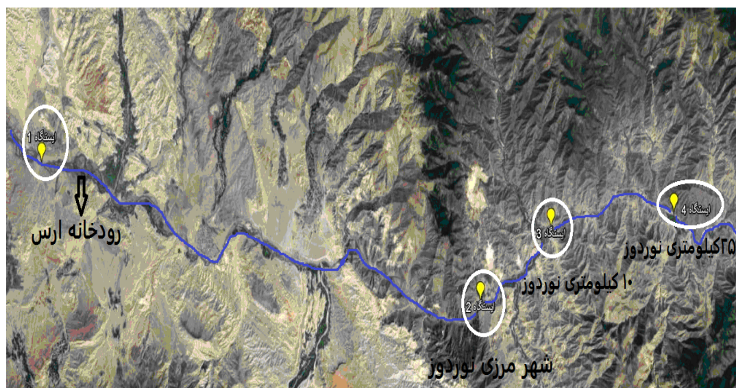
شکل ۱- تصویر ماهواره ای موقعیت مکانی ایستگاه های رودخانه ارس